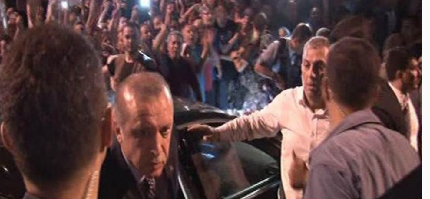
Cumhurbaşkanı Recep Tayyip Erdoğan Atatürk Havalimanı'nda

Bu sıralarda Cumhurbaşkanlığı Sarayı'nı ele geçirmeye çalışan darbeci askerler, polisler tarafından tutuklandı. Cumhurbaşkanı Recep Tayyip Erdoğan saat 04.00 sularında yolcu uçağıyla İstanbul'a indi ve Atatürk Havalimanı'nda bir basın açıklaması düzenledi.