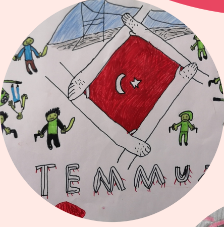
ÖMER KÜLÜLNK 6/A SINIFI