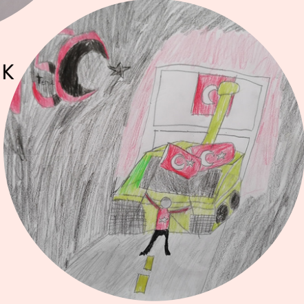
ÖMÜR BERKİN ŞANLI 6/A SINIFI