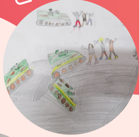
NİSANUR ŞENEL 3/A SINIFI