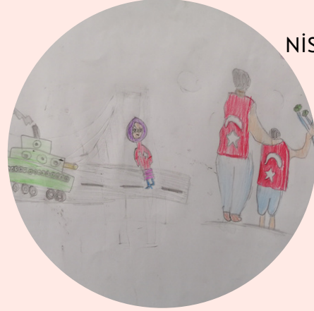
TUBA NAS BÜYÜKKOL 6/A SINIFI